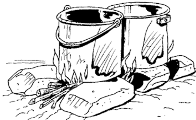
Fuoco al calore di pietra

Se nella zona vi sono grosse pietre piatte, potrai utilizzarle per fabbricare un ottimo forno. Per cucinarvi, accendi il fuoco all'interno di esso. Fai formare la brace e, quando non c'è più fiamma, introduci i cibi a cuocere. Metti un coperchio davanti all'apertura del forno, per non far disperdere il calore.